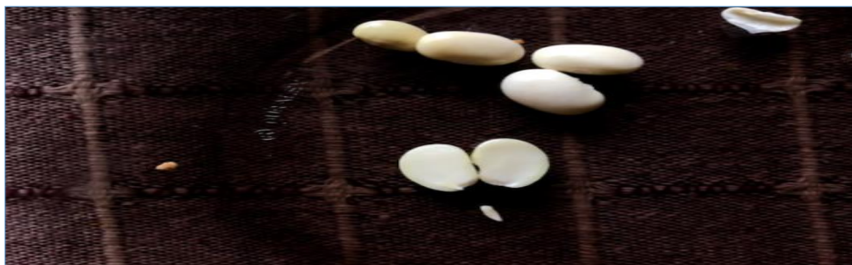
Симетрия в бобено зърно

Едно от децата заедно с майка си чистят боб и пеят на два гласа песента „Кавале, кавале“. Изведнъж детето спира и пита: „Мамо, знаеш ли, че цветето е симетрично? Ей така, като го завъртиш, то си остава същото“. Майката се смее. В следващия момент детето обелва едно зърно боб, разцепва го на две и казва: „И бобът е симетричен. Виж. И го ядем, за да станем и ние симетрични... Ама ние сме си симетрични. Линията минава точно през средата на носа“. И посочва.