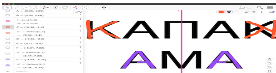
Изследване на симетрични думи в GeoGebra

Друга задача е свързана с осева симетрия на графичния образ на думите. Когато с едно от децата изследвахме това, се оказа, че някои думи са не само палиндромы (остават еднакви, ако се четат отпред назад и отзад напред), но са симетрични и по отношение на графичното им представяне. Симетрията ни изненадва отвсякъде, стига да сменим гледната точка!