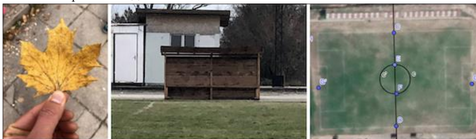
Листо от явор. Скамейка. Снимка на стадиона от сателит

Играта премина в търсене на симетрични обекти наоколо. Веднага забелязахме плочките, стадиона, скамейките, листата. Сгънахме едно листо на две, за да проверим дали двете страни съвпадат. Почти съвпаднаха! А това „почти съвпадение“ в естествения език означава да има симетрия . Макар скамейките да не бяха разположени симетрично спрямо централната линия на стадиона, всяка от тях е симетрична спрямо гредата в средата си. По време на изследването на симетрията с компютър забелязахме, че с направената от нас снимка на стадиона е трудно да се види симетрията спрямо централната линия. Затова решихме да използваме снимка от сателит.