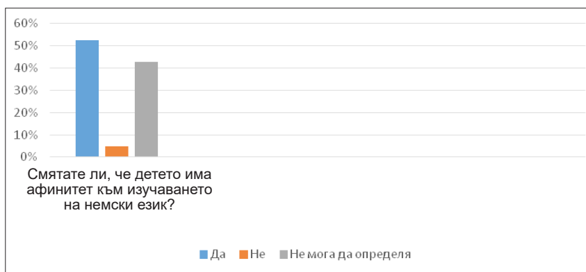
Фигура 2. Афинитет към изучаване на немски език

На въпроса „Смятате ли, че детето има афинитет към изучаването на немски език?“ 54% от анкетираните дават положителен отговор, 39% от тях не могат да определят, а 7% посочват, че детето не показва предпочитания да учи немски език в тази възраст. Графично резултатите се визуализират на фиг. 2.