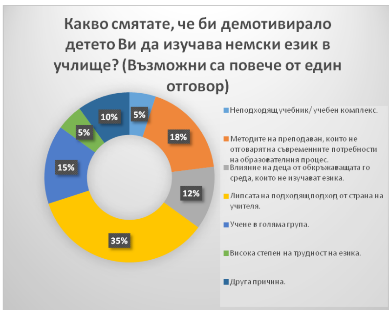
Фигура 4. Демотивация за изучаване на немски език

трябва да е съобразено с интересите, потребностите и желанията за изява на малките ученици.