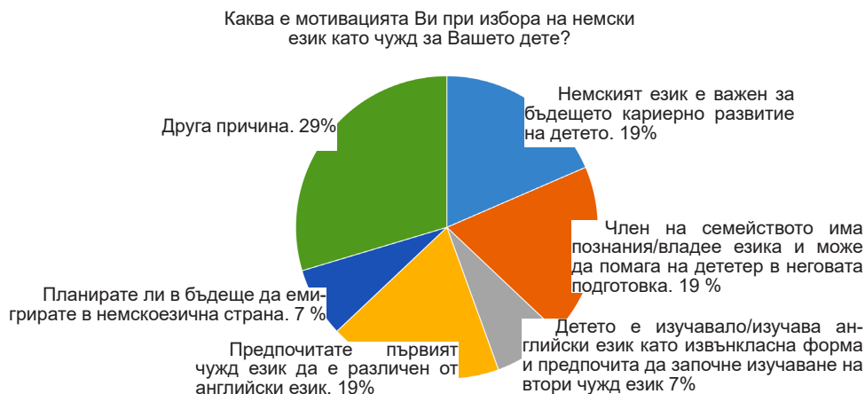
Фигура 1. Мотивация на родителите при избора на немски език като чужд

общуване с близки и роднини, носители на немски език. Един родител дава мнение, че детето е записано случайно в тази паралелка. Графично резултатите са изобразени на фигура 1.