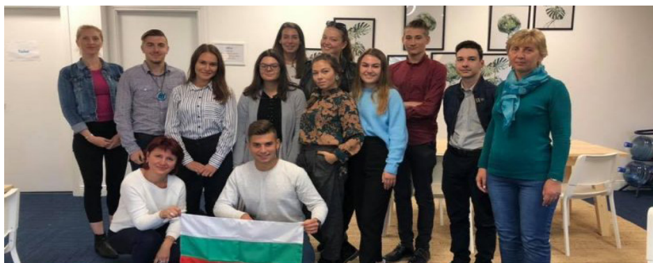
Групата в Дъблин