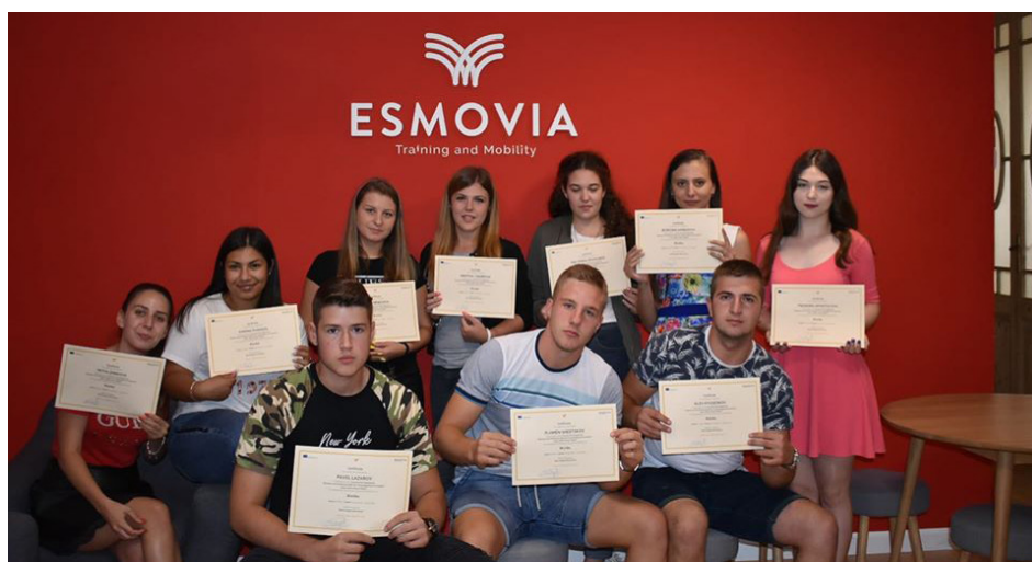
Групата във Валенсия