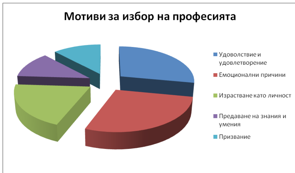
Фигура 3. Мотиви за избор на учителската професия

Процентното съотношение на желаещите да работят като учители може да се изобрази чрез фигурата по-долу.