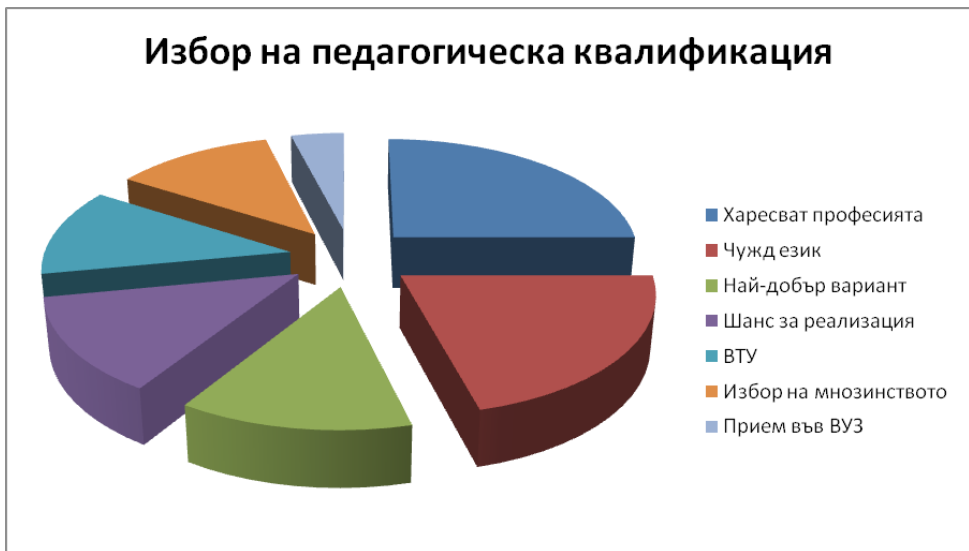
Фигура 1. Мотиви за избор на педагогическа квалификация

На въпроса „ По какво преддипломната педагогическа практика се различава от текущата практика? “ отговарят 11 студенти, а 18% изразяват следните становища: