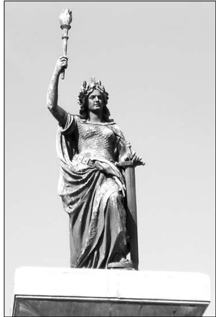
Монументът в Оряхово, посветен на загиналите румънски войници в Руско-турската война. Паметникът е издигнат на мястото, където са се водели боевете за освобождението на града.

Следващата творба на Арналдо Дзоки е в Оряхово и е посветена на загиналите румънски войници в Руско-турската освободителна война от 1877–1878 г. Монументът е издигнат през 1903 г. и представлява женска фигура, която символизира