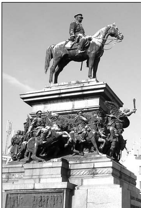
Паметникът на Цар Освободител в София, посветен на руския император Александър II

През 1900 г. Комитетът определя място пред Народното събрание за издигане на паметника и съставя програма за обявяване на конкурса. Изисква-