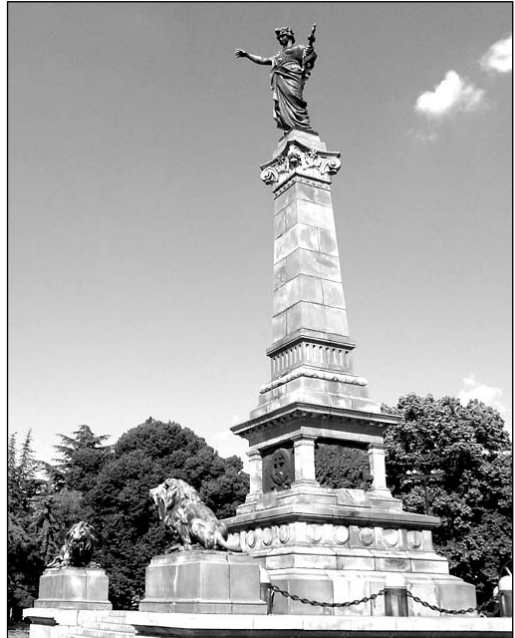
Опълченският паметник в Русе

Ателието на Дзоки в Рим е в близост до Порта Пиа – тих кът за спокойствие, където цари ред. То често се посещава от българските приятели на скулптора (Нурижан, 1934: 119–123). За съжаление след Втората световна война всичко е строено наново и няма и следа от двора, където е стояло гипсово копие на паметника на Цар Освободител. Тук Дзоки пише и неиздадените си спомени „По пътя на миналото, спомените на един художник“ (Sulle vie passato memorie d'arte), в които има немалко страници, посветени на България 9) .