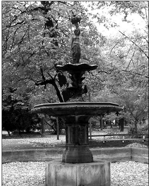
Фонтанът в Симеоновата градина в Пловдив, посветен на Съединението на Княжество България с Източна Румелия

Сега родната къща на Микеланджело е музей, в който няма нито една негова творба, но в двора на кастела през 1910 г. се издига скулптурна композиция, творение на Арналдо Дзоки. Бронзовият орелеф изобразява млада жена Микеланджело, който сякаш още от детските си години вижда бъдещите си творения.