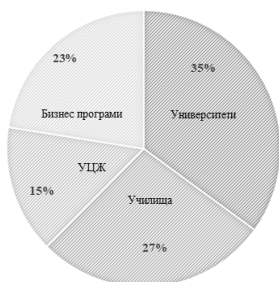
Фигура 1. Идентифицирани структурни елементи на образователните екосистеми

Първата обхваща основните институционални и секторни „актьори“, формиращи структурния обхват на екосистемите в образованието – училища, университети, бизнес организации и практики за учене през целия живот (фиг. 1). Във втората се открояват пет функционални измерения на образователните екосистеми, свързани с тяхната дигитализация, приобщаващ потенциал, добро управление, устойчивост и фокус към предприемачеството (фиг. 2).