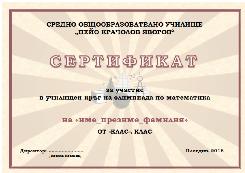
Фигура 2. Образец на грамота

Пример 1. С помощта на текстообработващата програма MS Word да се изработят сертификати за всички ученици, участвали в училищен кръг на олимпиада по математика.