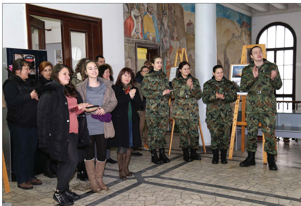
Фигура 2. Откриване на изложба в Регионалната библиотека „П. Р. Славейков“, януари 2016 г.

годишнината от създаването му на 25.11.2016 г. С 40 подбрани творби беше организирана изложба във фойето на културния ни дом от 24.11.2016 г. до 8.12.2016 г. На 16.01.2017 г. открихме фотоизложба в Регионалната библиотека, където бяха наградени отличените ученици и студенти от други учебни заведения. Ръководството на Университета остана изключително доволно от това, че се отваряме към другите образователни институции и разчупваме догмите за характера на учебното заведение. Поради лошите метеорологични условия не можах да присъствам част от наградените, които живеят по-далече от Велико Търново, но наградите им бяха връчени от директорите на училищата, където те се обучават.