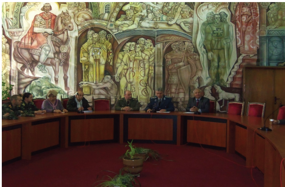
Фигура 4. Работно заседание на конференцията „Радиационната безопасност в съвременния свят“

опасност в съвременния свят“. Това е първи специализиран форум в областта на радиационната защита и възможност за изява на работещите и обучаващите се в тази специфична област. На него бяха представени 16 доклада от представители на различни държавни и научни организации от цяла България. Беше издаден и сборник с представените доклади.