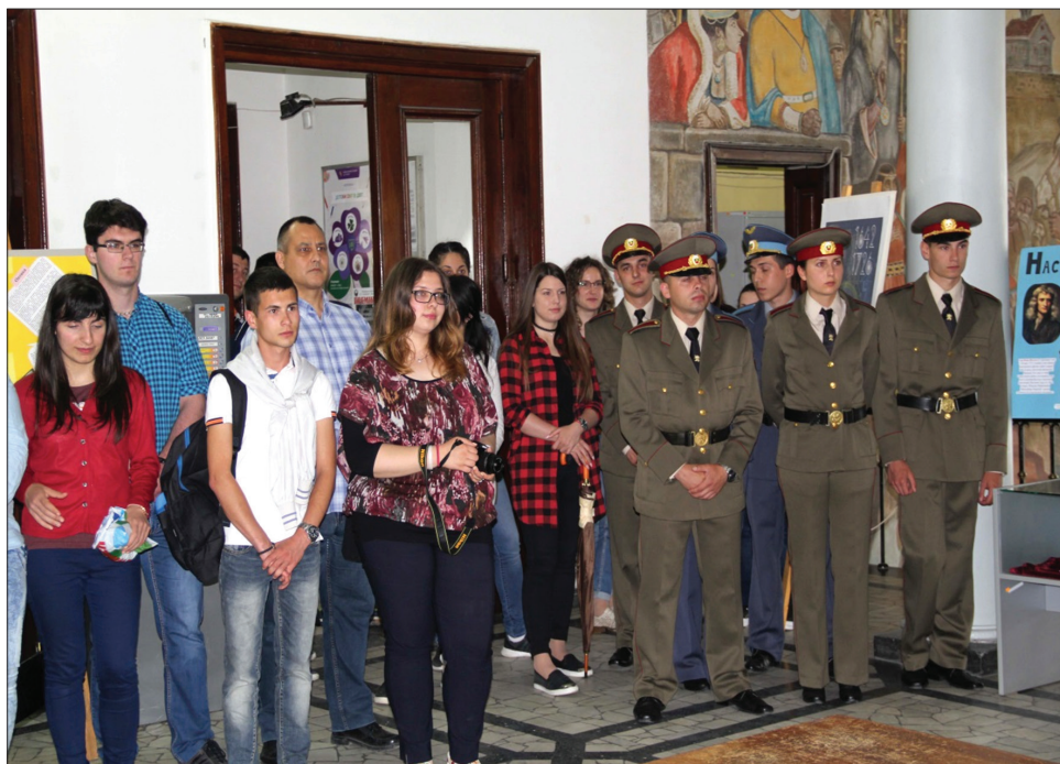
Фигура 3. Откриване на изложбата с отличените постери от конкурса „Наследството на Нютон“ на 17.05.2017 г.

В изложбата участваха представители от Велико Търново, Търговище, Варна, София и други градове. Бяха показани 70 модела на различна военна техника. Най-широко бяха представени бронирани машини и самолетите. Изложбата беше организирана по време на откриването на учебната година, клетвата на първокурсниците и Деня на отворените врати и беше нещо ново в нашия университет, което предизвика интереса на посетителите, особено на множеството ученици, които посетиха Националния военен университет през тази седмица. Пред моделите, представени в изложбата, бяха направени множество снимки и селфита.