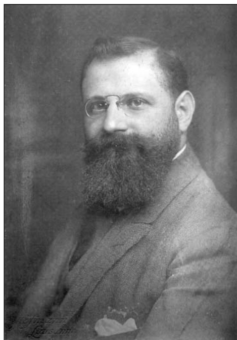
Портретна снимка на екзарх Стефан от времето на пребиваването му в Швейцария – 10 юли 1919 г., Женева (ДА – Смолян, ф. 473 К, оп. 2, а.е. 89, л. 1. Оригинал)

Автобиографичните материали на екзарх Стефан и в частност дневниците му са само част от неговото богато архивно наследство. Реконструкцията на личния архивен фонд на духовника категорично показва, че съдбата на личните му документи е толкова комплицирана, колкото и неговата биография.