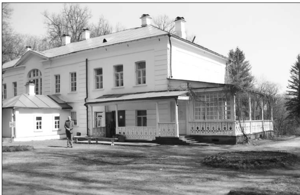
Снимка на къщата на Л. Н. Толстой в Ясна поляна

ците на тоя си бележник аз желая да внасям от време на време тъгата на сърцето си, страданията на душата си за вярата и благочестието си. Голяма е болката на моята душа, защото, от една страна, ясно съзнава своята греховност и още каква!, а от друга – няма силата да се избави от примките на злото, няма свободата и решителността да скъса връзките с житейщината и да залови чистия път на моралната обнова... “ 13 ).