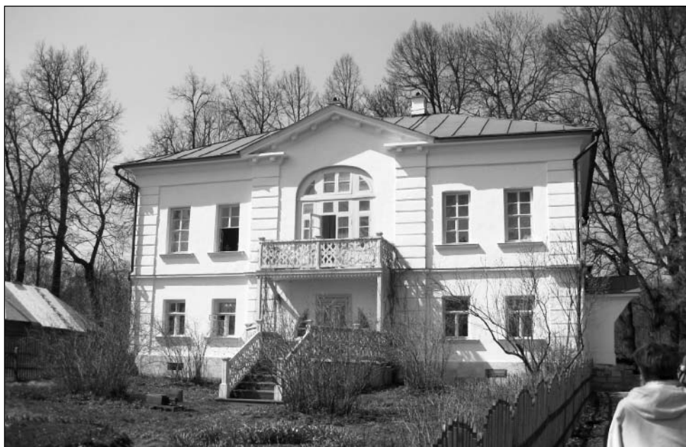
Снимка на училището в Ясна поляна

поради наличието на доста фрагменти, които, от една страна, могат да бъдат възприемани като разпръснати части от разпилян дневник, а от друга – като самостоятелни бележки или дори мемоари. При внимателно вглеждане в тези „отломки памет“ можем да видим в хронологически порядък видовете дневникови записки в архивното наследство на архиерея. Трябва да отбележим, че личните документи, които можем да определим като дневникописи, се съхраняват в три архивохранилища в три архивни фонда.