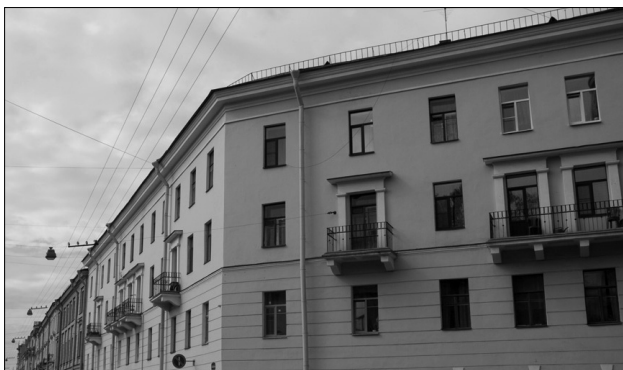
Дом Сонечки Мармеладовой

Имеется несколько вариантов движения от дома Сони Мармеладо-