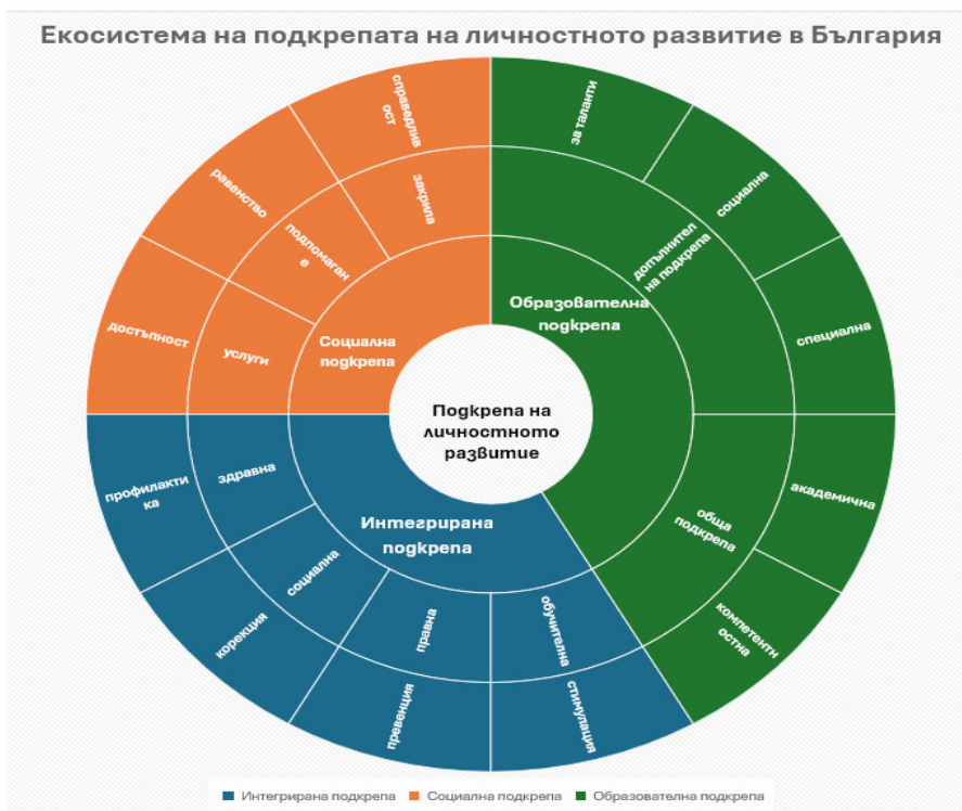
Фигура 2. Вътрешно и външно интегрирани цикли на екосистемния кръговрат на подкрепата на личностното развитие в България