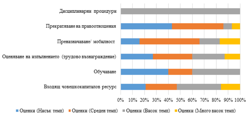
Фигура 2. Структура на темповете на прираст на показатели за човешки капитал

Първо, ускорението, видимо от равнището на темповете на прираст в основни показатели на човешкия капитал в държавната администрация, е показано на фигура 2.